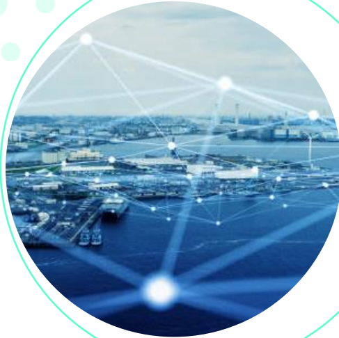
Impulso a la Economía Azul