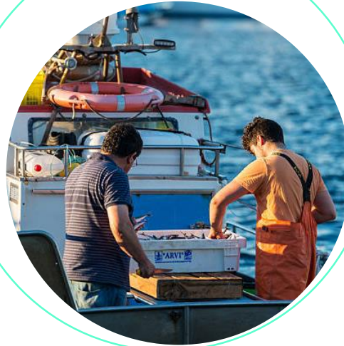
Atracción de jóvenes a los oficios del mar